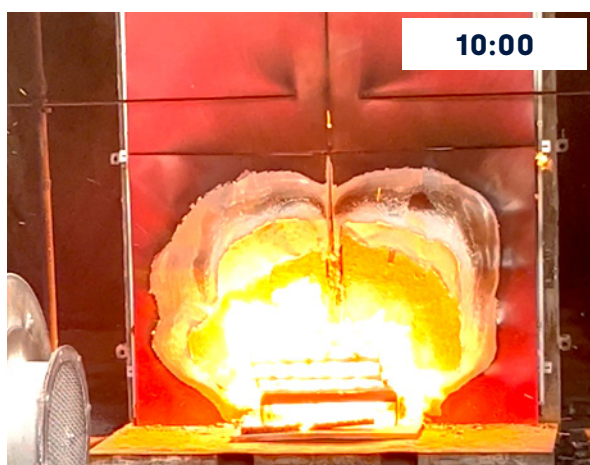
Minuto 10, podemos comprobar como las llamas destruyen el panel pero el fuego no se propaga.