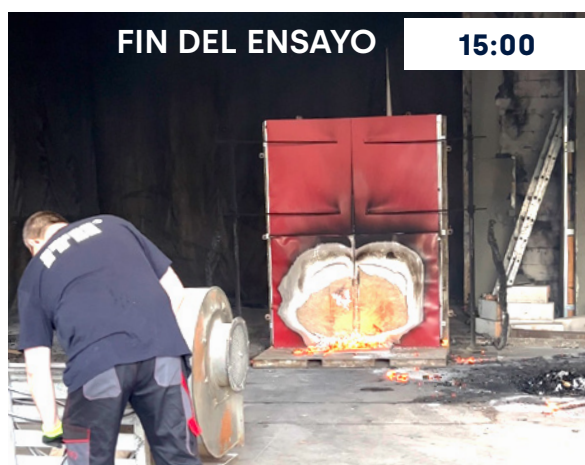
Minuto 15. Retirada del combustible y apagado del ventilador. Podemos comprobar como las llamas no se han propagado por la fachada y la llama se autoextingue.