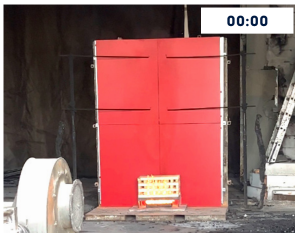
Minuto 0, inicio del ensayo, ignición del combustible.

Ensayo de reacción al fuego PN-B-02867:2013 | Polonia | Núcleo FR | Organismo: ITB, Instytut Techniki Budowlanej.