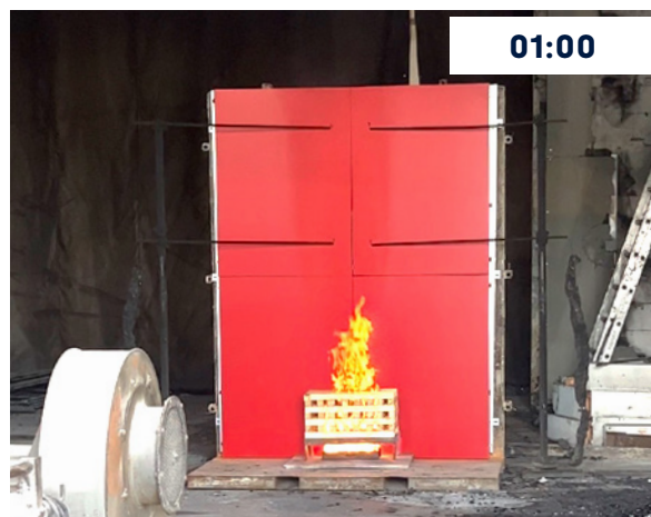
Minuto 1, incidencia de la llama sin viento.