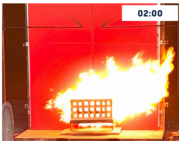
Minuto 2, se pone en marcha el ventilador para aumentar la incidencia del fuego sobre la fachada.